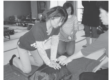
救急法講習で心臓マッサージを練習する様子