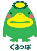
久留米市イメージキャラクター

発行 社会福祉法人 久留米市社会福祉協議会 三潞支所 三潞総合福祉センターゆうゆう 久留米市三潞町玉満1790 TEL 0942-65-1200 FAX 0942-65-1219