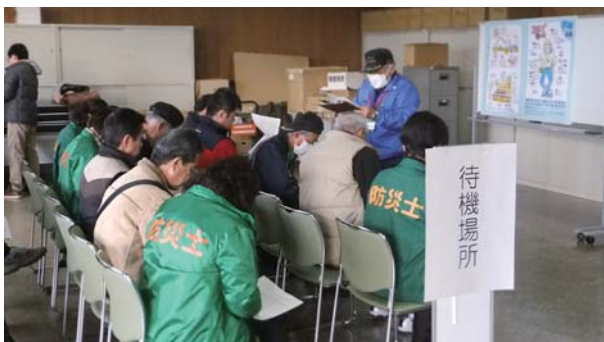
災害ボランティアセンター設置運営訓練の様子