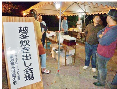
路上生活者越冬支援活動による炊き出しの様子