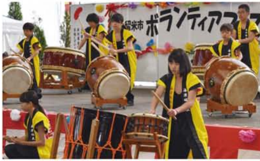
ボランティアフェスティバル

○ボランティア活動に対する市民の関心を高め、活動への参加につなげることを目的に「久留米市ボランティアフェスティバル」を開催しました。 ○ボランティア活動に対する市民の関心を高め、活動への参加につなげることを目的に「久留米市ボランティアフェスティバル」を開催しました。 ○ボランティアセンター情報紙「まれっと」を発行し、ボランティアの募集やボランティア団体を活性化するための情報を発信しました。