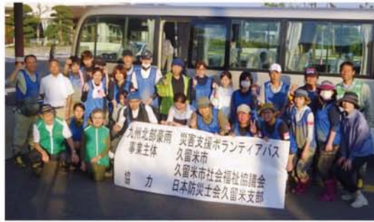
災害支援ボランティアバス

市災害ボランティアセンターに職員を派遣しました。また、市との共催で久留米市災害支援ボランティアバスを運行し、50日間で延べ753人の市民ボランティアが活動に参加しました。