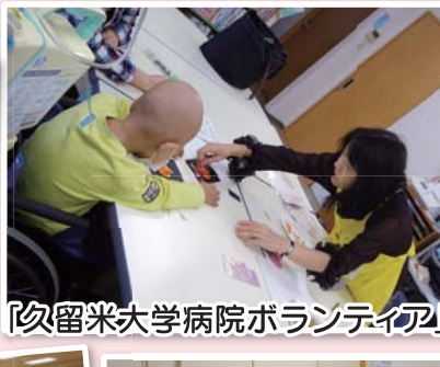
「久留米大学病院ボランティア」