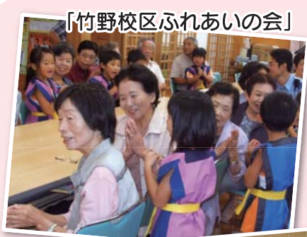
「竹野校区ふれあいの会」