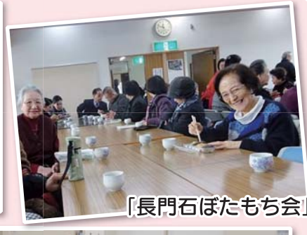
「長門石ぼたもち会」