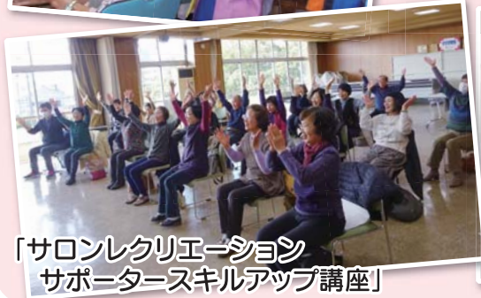
「サロンレクリエーション サポータースキルアップ講座」