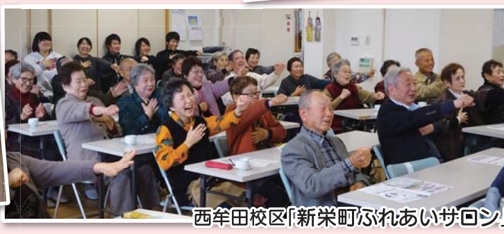
西牟田校区「新栄町ふれあいサロン」