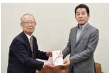
真如苑久留米様 (写真:右)