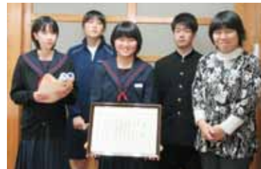
久留米市立 良山中学校 (ボランティアクラブ)