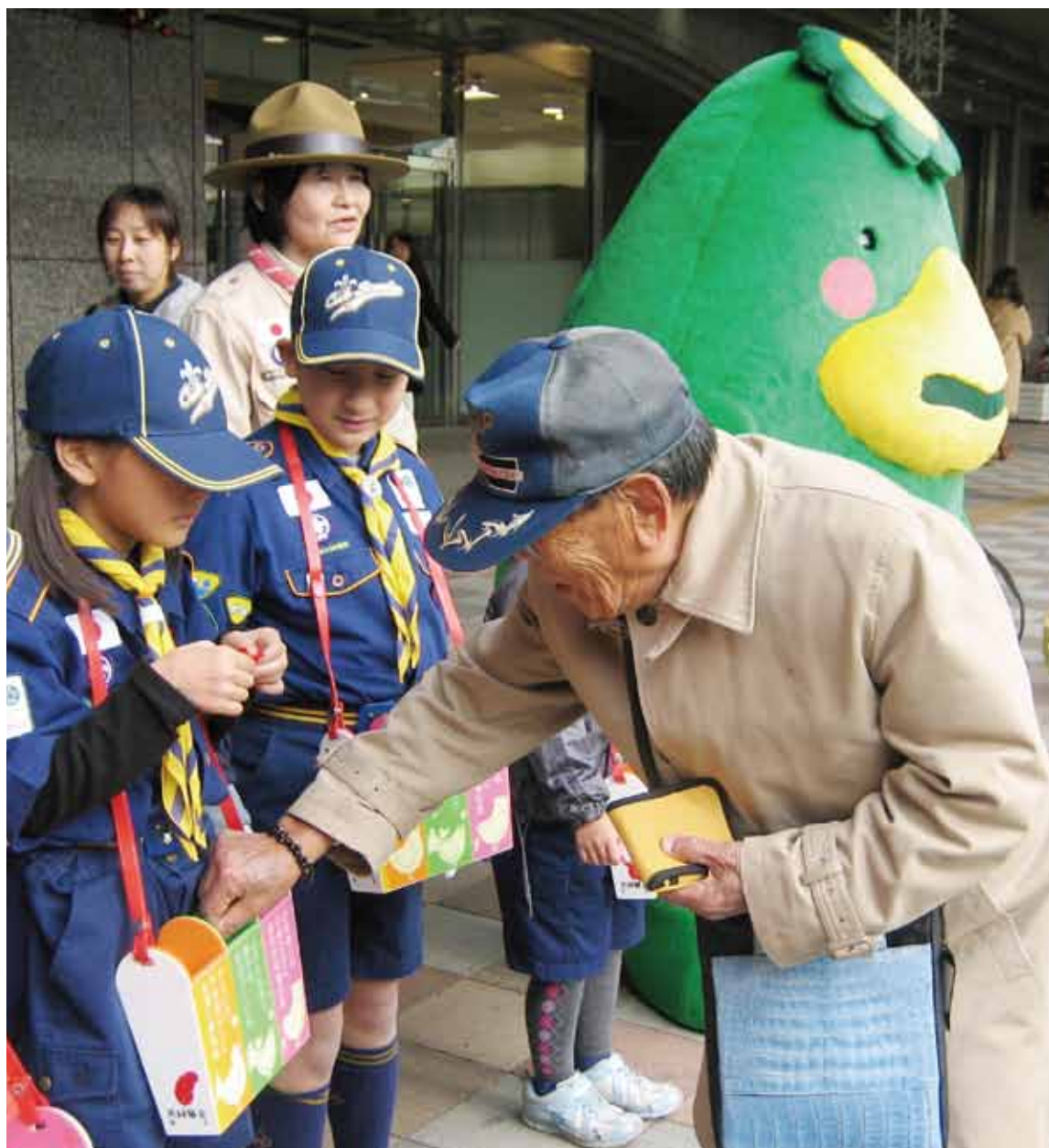
平成30年12月8日ボーイスカウト第10団による街頭募金の様子(岩田屋久留米店前)

《内訳》赤い羽根共同募金(一般募金) : 57,195,382円 歳末たすけあい募金 : 15,487,138円