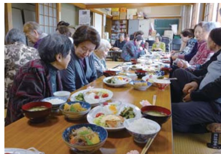
ふれあいの会の活動 会食や配食など集いの輪をひろげます。