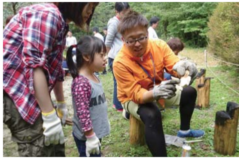
サマーデイキャンプ 若者のボランティア活動を応援します。