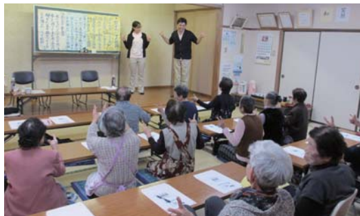
ふれあい・いきいきサロン 誰もが気軽に集える場として広めていきます。