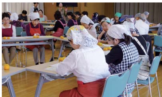
ボランティア連絡協議会研修 ボランティアの学習を応援します。