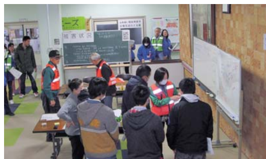
災害ボランティアセンター設置訓練 水害を想定した訓練の様子