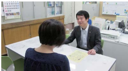
市成年後見センター

センターでは、成年後見制度に関する相談を受けたり、制度の普及啓発に取り組めます。