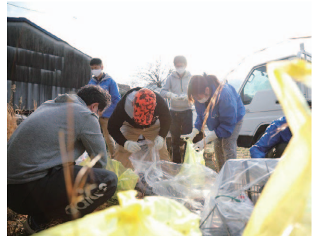
本人、社会福祉法人、地域住民が協働で住宅環境整備する様子

などに取組みます。 社会福祉法人と連携した取組みについて関心 のある方は、お問合わせください。