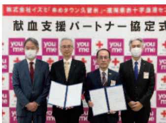
左:福岡県赤十字血液センター 右:株式会社イズミ ゆめタウン久留米

一段と寒さが増すこれからの時期は献血者も減少する傾向にあります。ぜひ献血にご協力をよろしくお願いします。