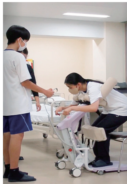
移乗介助機器の体験