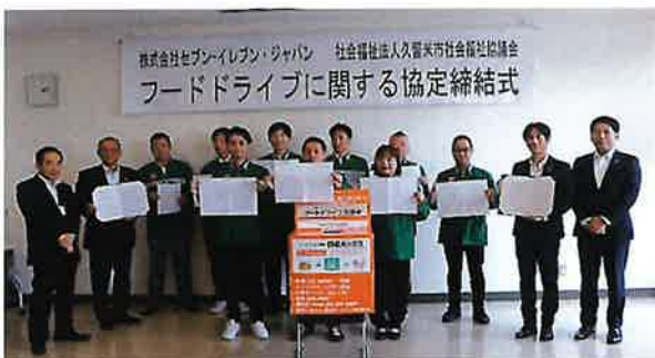
当日は9店舗のオーナーも参加

フードドライブは「もったいない」を「ありがとう」に変える活動です。食品ロスの削減だけでなく、食料を必要としている場所・世帯等に提供し、活用するという福祉的な活動にも通じています。皆様の身近なセブン-イレブンで寄付が可能になります。お近くの店舗でのご協力をぜひよろしくお願いいたします。