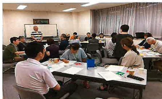
FD団体・子ども食堂など19名が参加

ボランティアセンターでは、必要とされる世帯に食支援が届くよう、今後も団体同士のネットワーク作りへ共に取り組んでいきます。