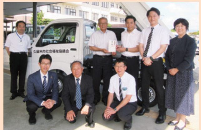
上段右から3人目:末日聖徒イエス・キリスト教会 福岡ステーク 甲斐会長