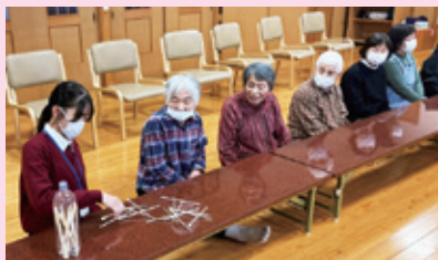
一緒にサロン活動を楽しむ様子