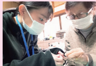
作品づくりを一緒に行う様子

作品づくりを通じて、本人の趣味を一緒に楽しむことで、本人の性格や強みを見つけることができました。一緒に楽しめることで話しやすい雰囲気づくりにつながり、関係の扉が少しずつ開いていくのを実感しました。