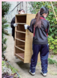
引越しの支援をする様子

市社会福祉協議会が行っている取り組みは、地域の支援から個人の支援まで様々で、その一つひとつが地域の支え合いにつながるということを学びました。