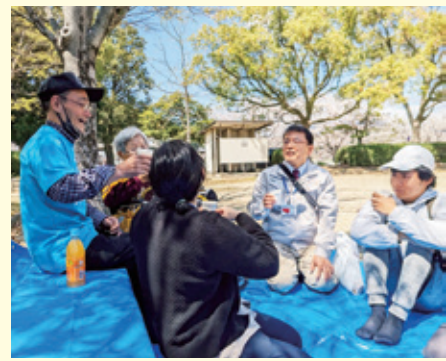
つながりを広げる活動をします