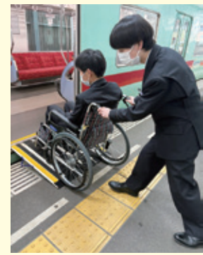
福祉教育の充実を図ります