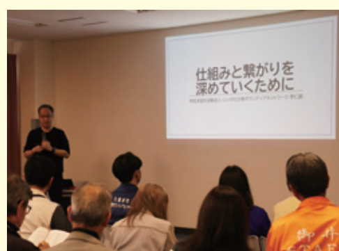
関係機関と情報共有の場を設けます