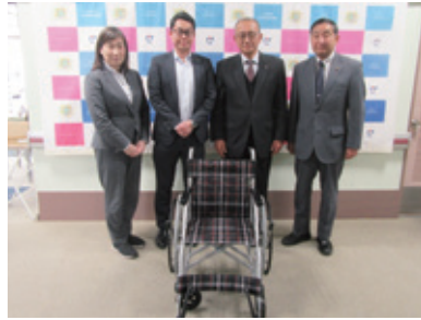
明治安田生命久留米支社(本町)