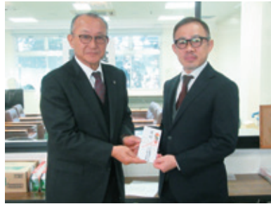
日本競輪選手会福岡支部 久留米事務所(野中町)