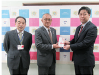
B-Life株式会社(篠山町) フリーランスプランニング株式会社(篠山町)