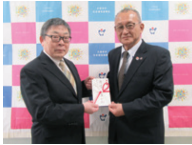
真如苑久留米(野中町)