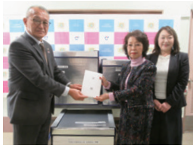
公益社団法人久留米法人会(城南町)