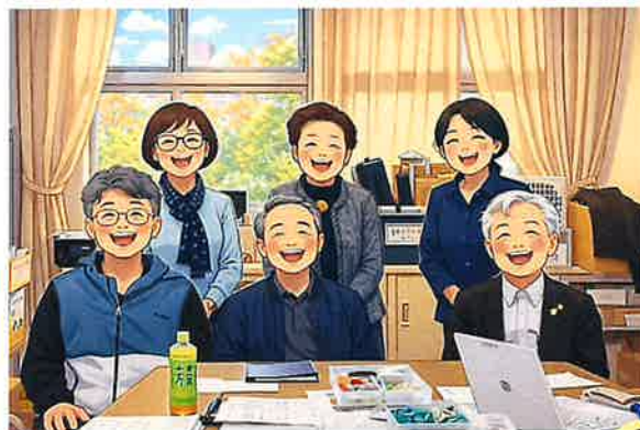
ボランティア連絡協議会 理事の皆さん

ボランティア活動を行う中で、後継者不足などの課題を抱えることも多いかと思えます。多くの団体と一緒に考えることで解決の糸口にしてみませんか？ぜひ加入したい団体があれば、ボランティアセンターまでお尋ねください。