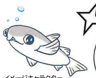
イメージキャラクター ボラちゃん