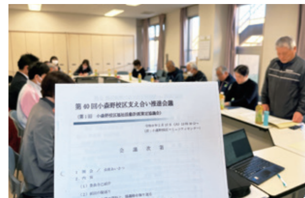
校区福祉活動計画策定の様子