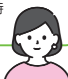
久留米大学 外国語教育研究所 准教授

災害時の問題は、言葉の壁より孤立感。非常時につながりがない場所で孤独を感じるのは、みんな一緒です。日々あいさつを交わして顔を覚えてもらっている安心感が、非常時に生きるはずです。