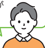
久留米工業大学生

福祉は高齢や介護、施設といったイメージ。遠い未来のことで、自分事として捉えることが難しいです。でも、知ることによって協力が広がる幅が広がると思います。