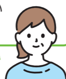
『ちょいボラ』参加者

実際に参加してみると、「これくらいならできる」と自信にもなるし、楽しい。「小さなことができるがある」と知れば「それなら手伝える」という人は多いと思います。