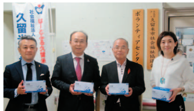
久留米東ロータリークラブ様

久留米東ロータリークラブ様、北九州第一ライオンズクラブ様より災害用資機材等の寄付、NPO法人たくみの会様、JAM九州・山口様より寄付金をいただきました。 ご寄付は、災害時や社会福祉事業に有効に活用させていただきます。