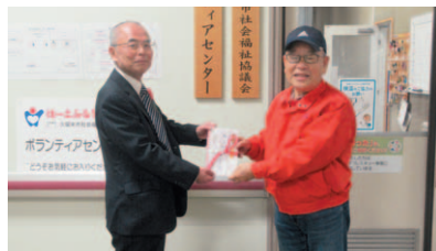
NPO法人たくみの会様