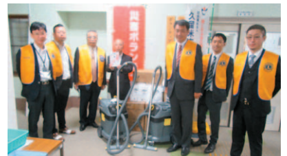
北九州第一ライオンズクラブ様