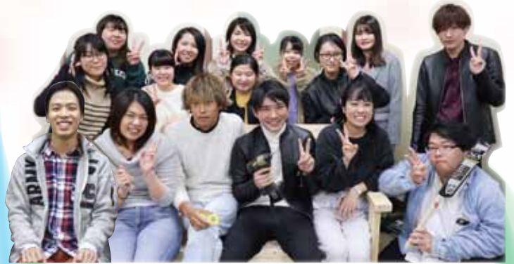
久留米学生ネットワークのみなさん